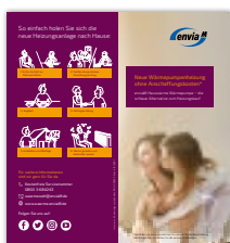
Produktflyer Wärmepumpe Der Flyer beinhaltet allgemeine Informationen für den Kunden, Erklärungen zum Produkt und welche Vorteile das Produkt bietet.