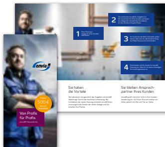
Flyer für Installateure Der Flyer beinhaltet allgemeine Informationen für Installateure zu enviaM Hauswärme.