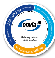
Magnet für die Heiztherme Den Magneten bringen Sie an die neu installierte Wärmeerzeugungsanlage an. Der Kunde soll im Störfall sofort die Störhotline anrufen.