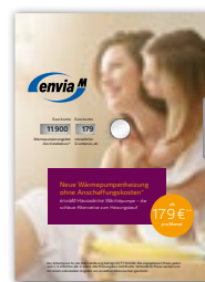
Drehscheibe Wärmepumpe Zeigen Sie Ihrem Kunden den monatlichen Grundpreis für enviaM Hauswärme Wärmepumpe auf Basis des Wärmepumpenangebots sowie die Kosten für die Wärmelieferung.

Fragen beantworten wir Ihnen gern unter: