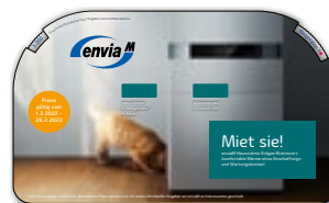
Drehscheibe Brennwert Zeigen Sie Ihrem Kunden den monatlichen Grundpreis für enviaM Hauswärme Brennwert auf Basis der Investitionskosten sowie die Kosten für die Wärmelieferung.