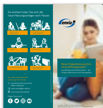
Produktflyer Brennwert Der Flyer beinhaltet allgemeine Informationen für den Kunden, Erklärungen zum Produkt und welche Vorteile das Produkt bietet.